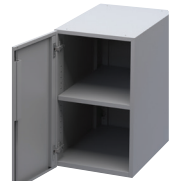
Módulo de almacenamiento individual con puertas con cerradura