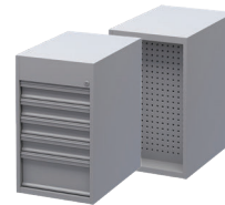
Módulo de almacenamiento de herramientas