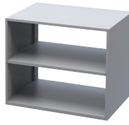
Módulo de almacenamiento doble