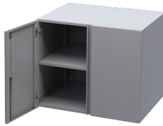
Módulo de almacenamiento doble con puertas con cerradura