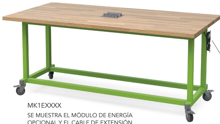
MK1EXXXX SE MUESTRA EL MÓDULO DE ENERGÍA OPCIONAL Y EL CABLE DE EXTENSIÓN