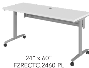
24" x 60" FZRECTC.2460-PL