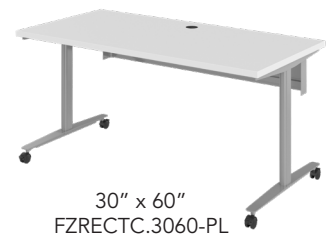
30" x 60" FZRECTC.3060-PL